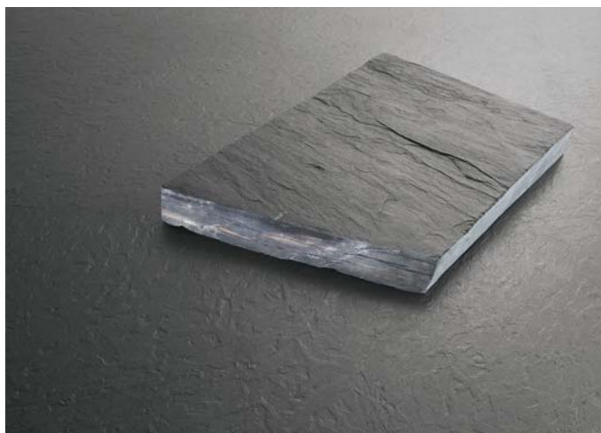
norament® 925 serria