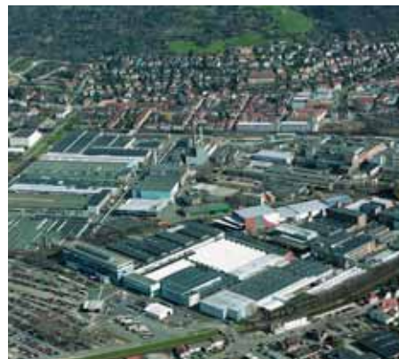
Centrum för Freudenberg-gruppen: fabriken i Weinheim