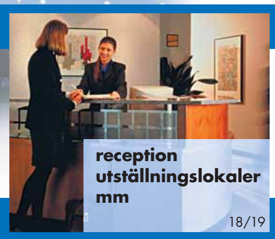
reception utställningslokaler mm