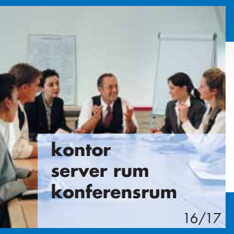
kontor server rum konferensrum